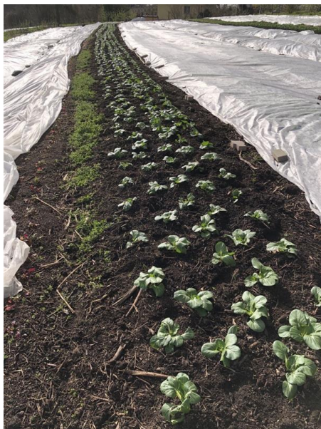
Image 2 : Cultures recouvertes d'un voile non-tissé

Les fluctuations de température observées ces dernières semaines compliquent la gestion des parcelles couvertes de voiles non tissés. Lors des nuits fraîches, il est important de protéger les jeunes cultures à l'aide de non-tissé ou de filets afin d'éviter la montée en graines.