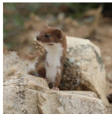
Image 1 : Une belette à la recherche d'une proie.

Texte adapté de l'OeGR 01/26 – Ulricke Fischbach