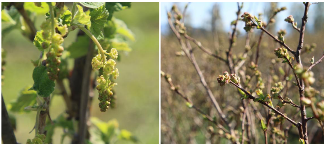
La floraison commence pour les groseilles – sur la photo de gauche, la variété Rovada – tandis que pour les myrtilles, les premières fleurs sont attendues cette semaine ou la semaine prochaine – photo de droite, variété Duke (09/04/2026, kogb)