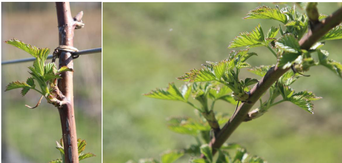
Les framboises d'été (photo de gauche : variété Meeker) et les mûres (photo de droite : variété Lochness) sont en train de bourgeonner (09/04/2026, kogb)

Chez les myrtilles , les feuilles et les fleurs se développent ; les premières fleurs s'ouvriront dans les prochains jours.