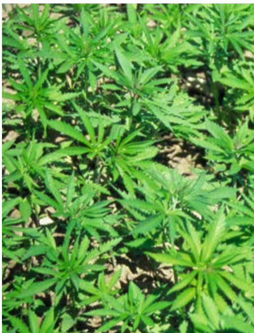
Le chanvre agricole couvre bien le sol et se passe souvent de tout désherbage.