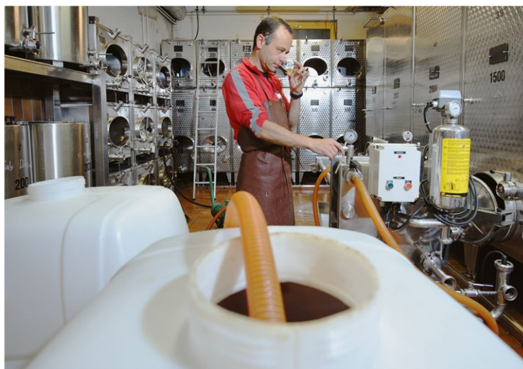
Filtrazione del vino mediante un filtro a piastre

Conformemente alle direttive di Demeter , non sono consentiti nuovi acquisti di serbatoi metallici rivestiti di resina epossidica o di fibra di vetro per l'affinamento dei vini. Sono ammessi recipienti di cemento, legno, porcellana, acciaio inox, grès e terracotta.