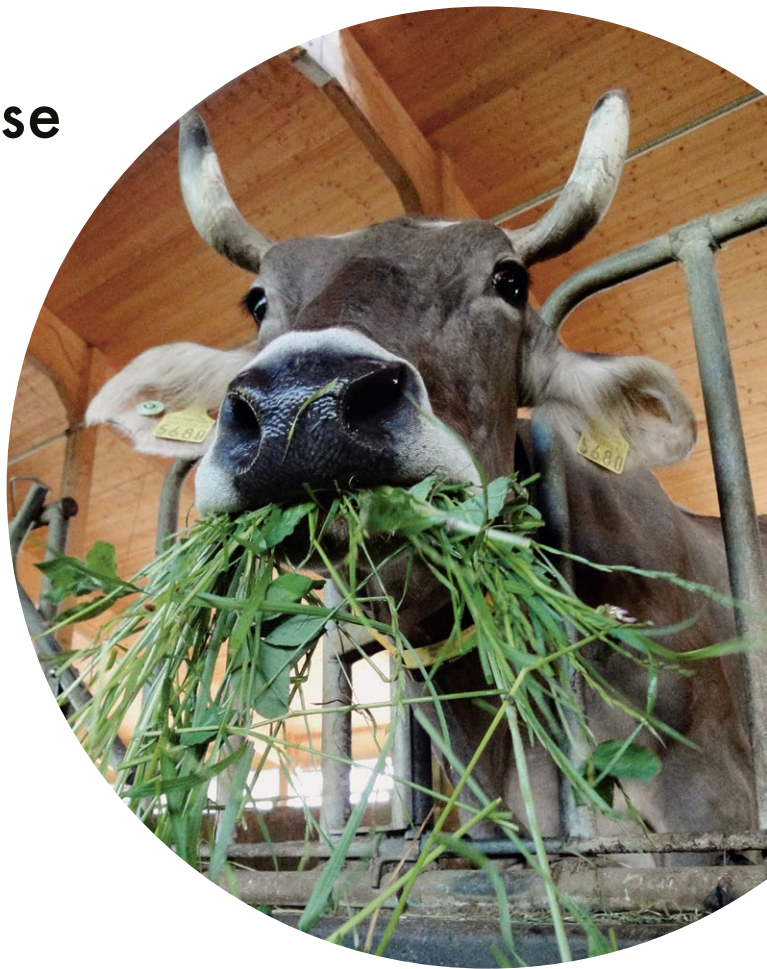
Fourrages OBio CH / RBio UE max. 10 %