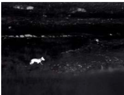
Loup observé aux jumelles thermiques.

> la protection des alpages. Créée en 2020, elle a pour but de soutenir les bergères et les bergers confrontés au loup et à faciliter la coexistence entre élevage et grands carnivores. «On savait que les loups allaient revenir. Alors on les a appelés à la rescousse. Le lendemain, ils étaient là.»