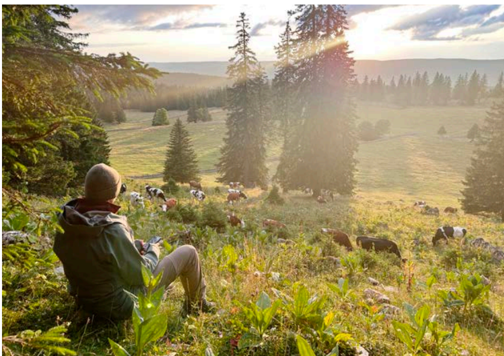
La surveillance humaine est aujourd'hui la mesure la plus efficace pour protéger un troupeau.

Infos sur l'Organisation pour la protection des alpages www.oppal.ch